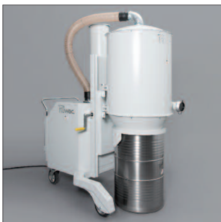
Butoi de 200 litri