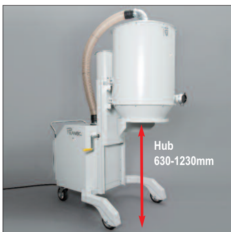
Unitate de separare reglabilă individual