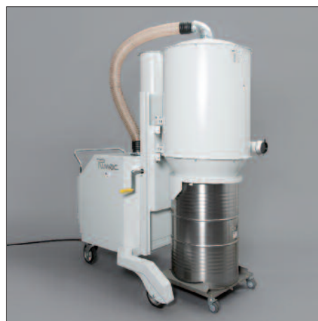
Butoi de 200 litri cu cârucior