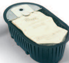
Sacul filtrului de praf