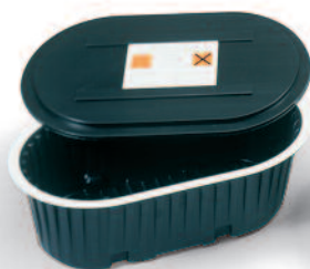
Cuvă pentru golire cu capac